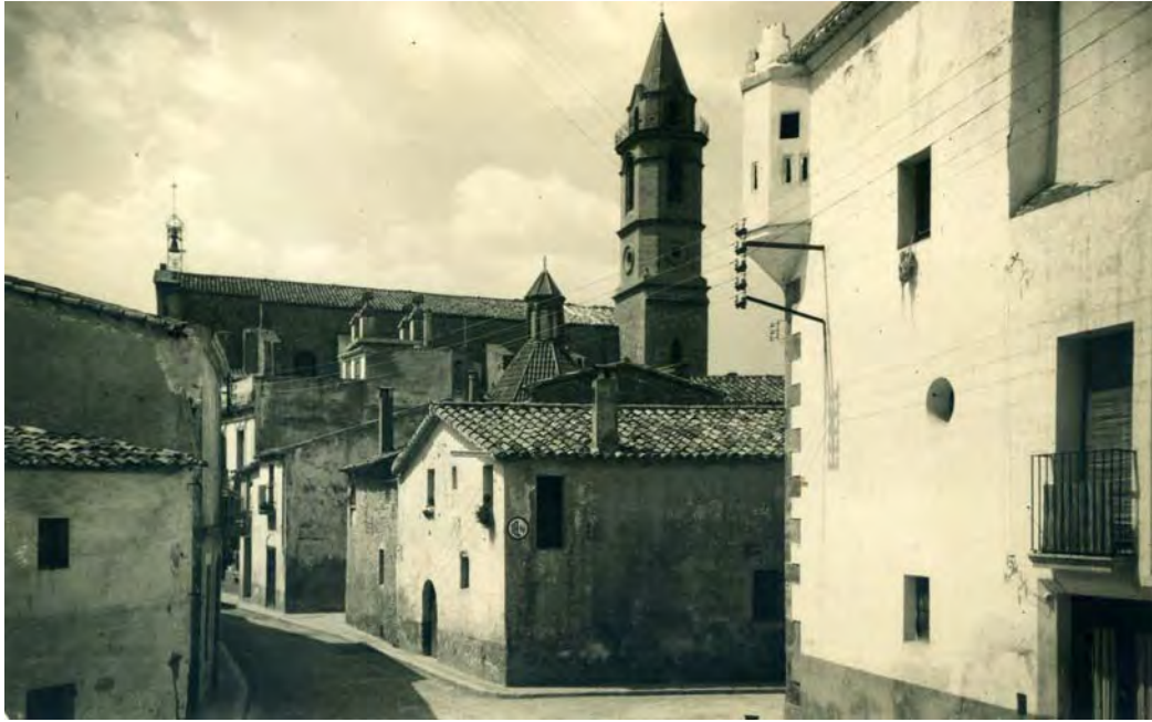
Carrer del Marquès de Gelida, vers 1950. Cantonada de cal Cadiraire.