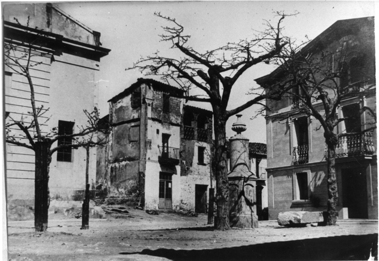
La plaça de l'església abans de 1916. Al centre, ca l'Armengol.