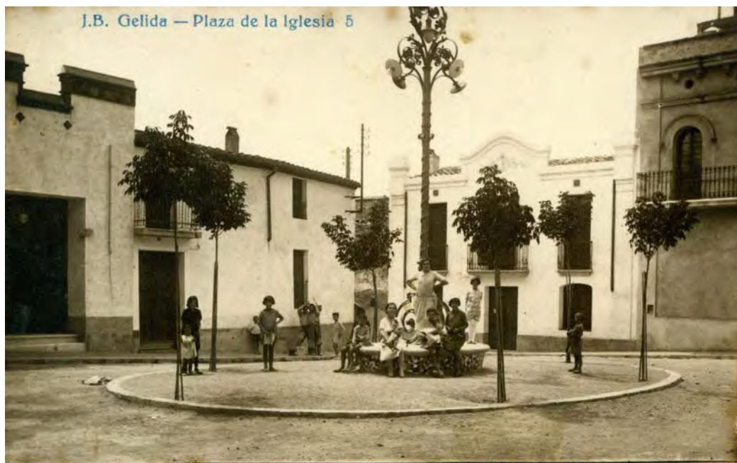
La plaça als voltants de 1930. Cal Maco.