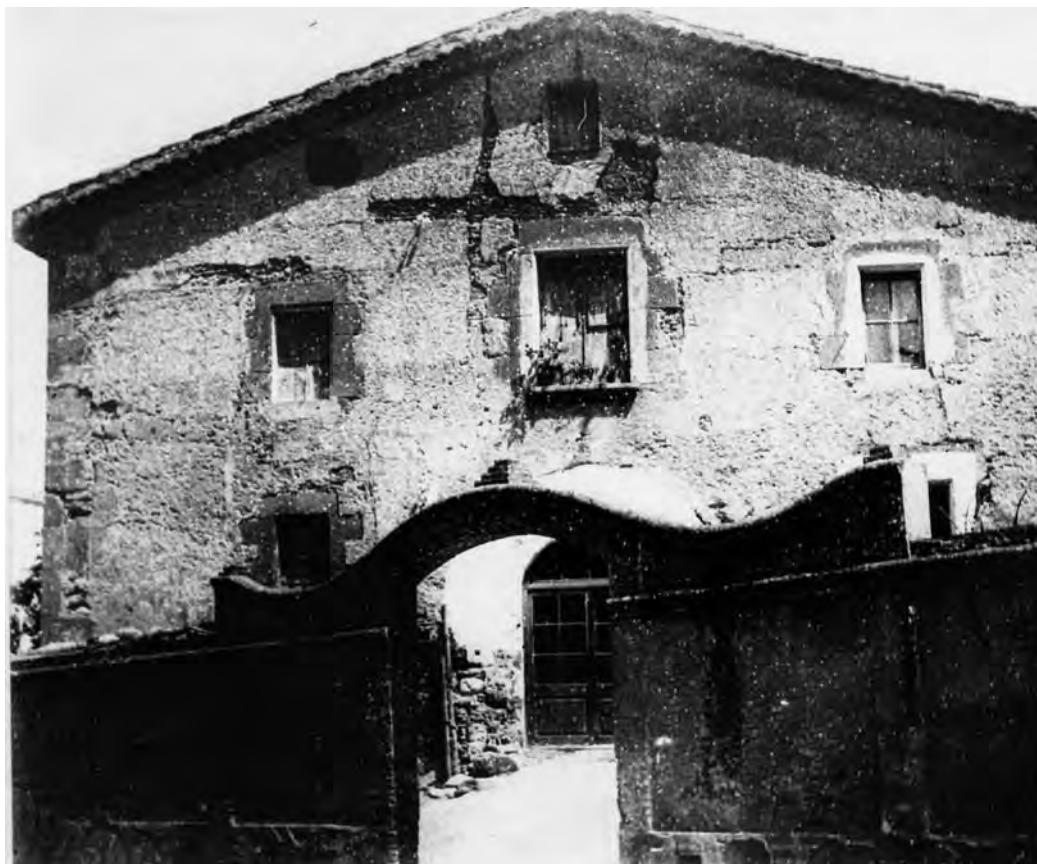
2.- Cal Terra de Gelida.