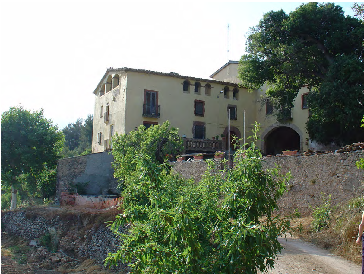
1.- Can Ginebreda de Gelida.